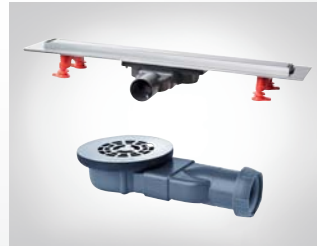
CANALETA Y VÁLVULA DE DUCHA SLIM