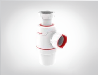
SIFÓN LAVABO, BIDÉ O FREGADERO WIRQUIN NEO