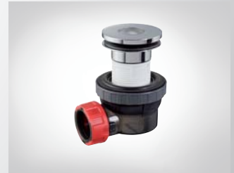
CONJUNTO LAVABO NANO 6.7